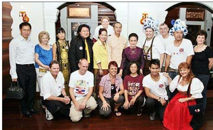
Das Team der Thailandfreunde mit den Ehrengästen.